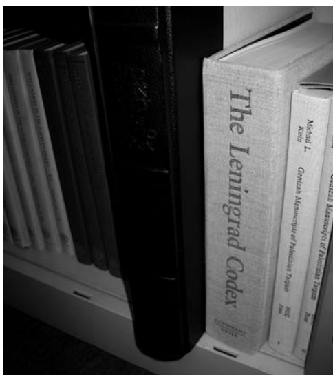
Le «Codex de Leningrad» (1008), le plus ancien et le plus complet des manuscrits de la Bible en hébreu.

Fribourg l'un des principaux centres internationaux dans le domaine de l'histoire du texte de la Bible. Il n'est pas exagéré de parler de trésor, car il faut faire quasiment le tour du monde pour mettre la main sur les documents rassemblés ici. Pour pérenniser cet héritage et assurer la relève, les élèves et collaborateurs du Père Barthélemy ont ainsi fondé l'Institut Dominique Barthélemy pour l'histoire du texte et de l'exégèse de l'Ancien Testament. Il s'agira dans un pre-