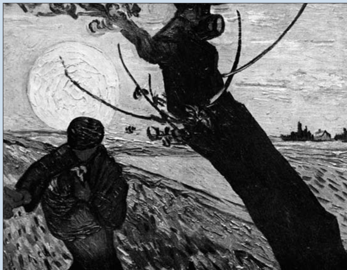
Le Semeur de Vincent Van Gogh (1888).

Chaque personne qui sème entre terre et ciel connaît des périodes de calme, durant lesquelles elle ne peut travailler le sol, durant lesquelles elle n'a rien besoin de faire. Autrement