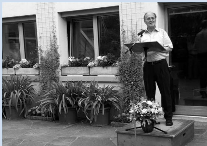
Le recteur Urs Altermatt lors de l'apéritif du 20 juin au Jardin botanique.

insbesondere zur europäischen Einigung im 20. und 21. Jahrhundert, durchgeführt werden. Das «Center for European Studies» wird dadurch zu einem Begegnungszentrum für Forscherinnen und Forscher werden, die sich mit Europa auseinandersetzen.