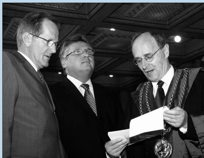
Urs Allematt en compagnie de Joseph Deiss accueillent le président polonais Aleksander Kwasniewski lors de sa visite officielle en Suisse les 16 et 17 septembre 2004

«Zweisprachigkeit-Plus» ausserhalb des ordentlichen Budgets verwirklichen kann.