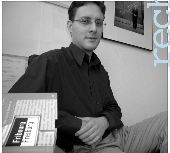
L'Université fut l'un des moteurs du bilinguisme à Fribourg, selon B. Altermatt.

D'abord pour des raisons familiales : je ne voulais pas étudier chez mon père (ndlr : le Recteur Urs Altermatt). Mais aussi pour des raisons plus profondes : j'ai grandi en ville de Fri-