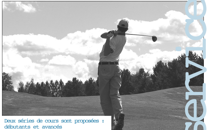
Deux séries de cours sont proposées : débutants et avancés