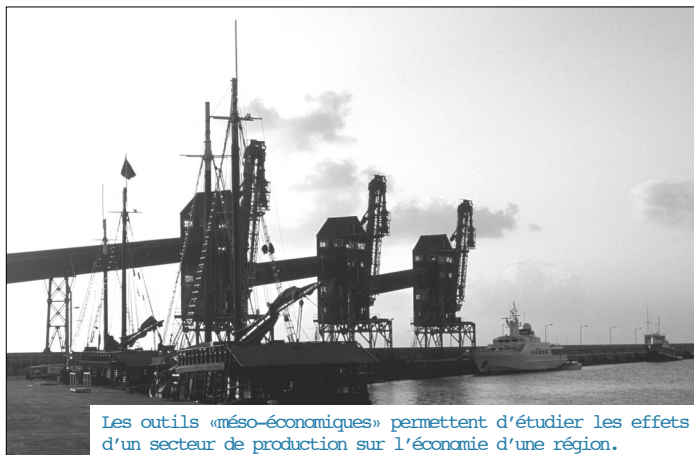
Les outils « méso-économiques » permettent d'étudier les effets d'un secteur de production sur l'économie d'une région.