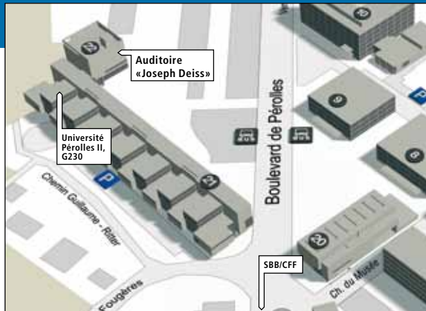
Péroles II, Bd de Péroles 90, CH-1700 Fribourg