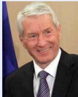
Thorbjørn JAGLAND Secrétaire Général du Conseil de l'Europe Ancien Premier ministre de Norvège