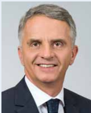
Didier BURKHALTER Vice-président du Conseil fédéral Chef du Département fédéral des affaires étrangères