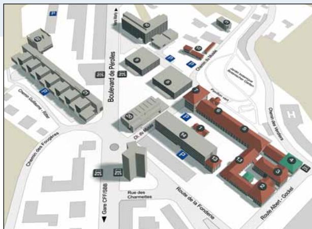
Péroilles II, Bd de Péroilles 90, CH-1700 Fribourg