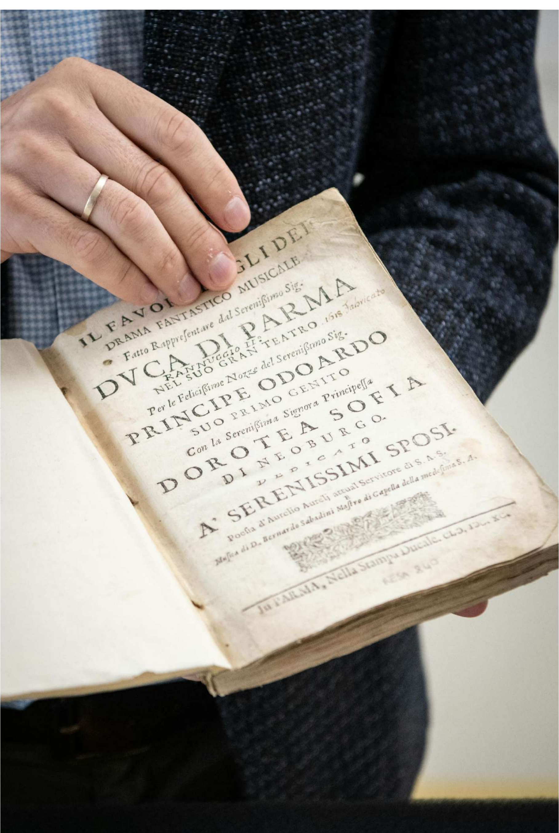
La page de titre du «drame fantastique musical» Il Favore De Gli Dei.