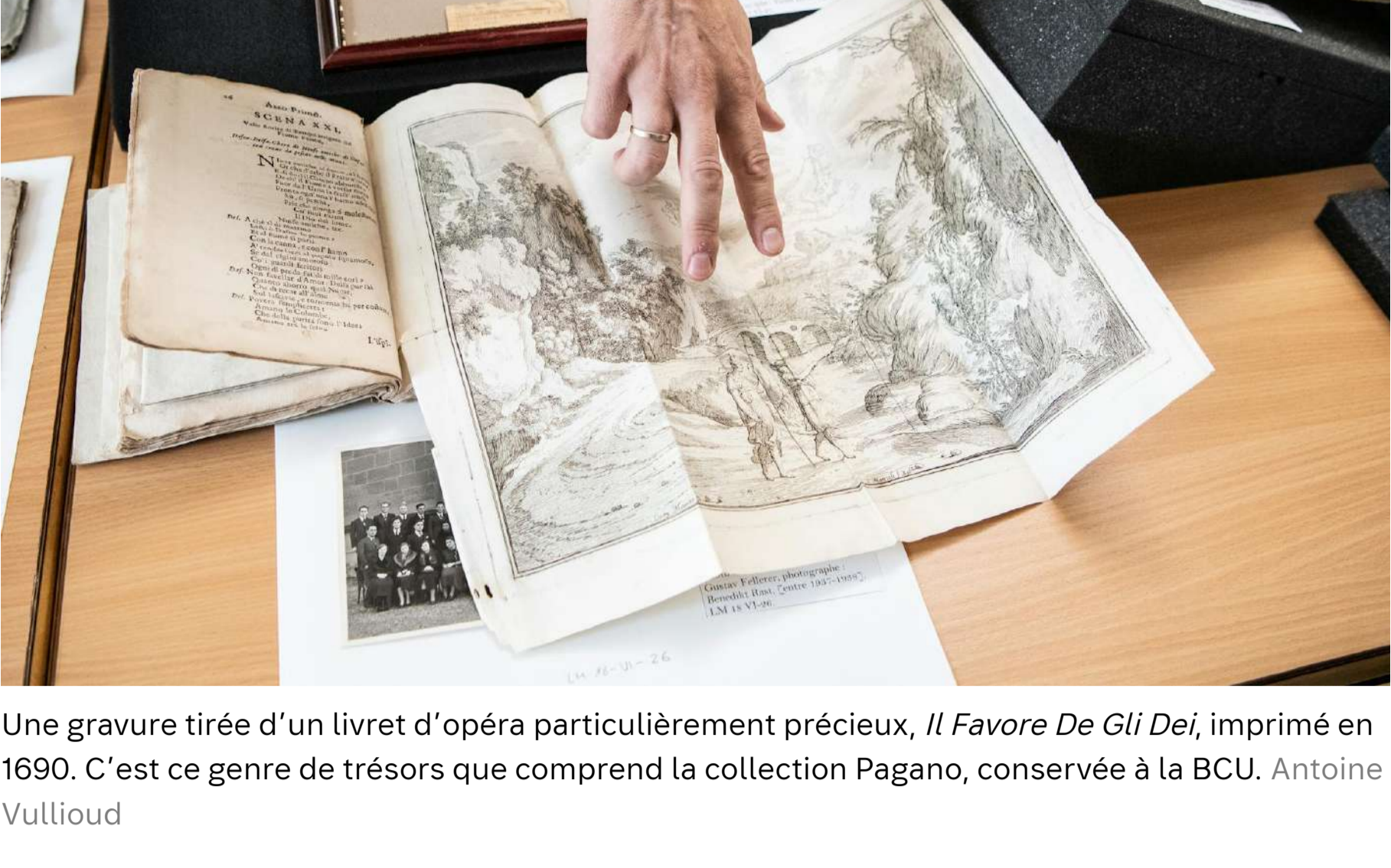
Une gravure tirée d'un livret d'opéra particulièrement précieux, Il Favore De Gli Dei , imprimé en 1690. C'est ce genre de trésors que comprend la collection Pagano, conservée à la BCU. Antoine Vullioud

Partager sur Facebook, Twitter, LinkedIn, WhatsApp