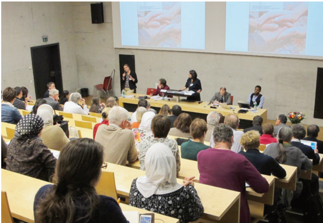
Une vue d'un séminaire organisé par le Centre suisse islam et société.

Parmi les institutions offrant déjà ce type de formations, on trouve notamment l'Université de Genève et la Haute Ecole pédagogique de Fribourg, qui organisent régulièrement des séminaires autour de la migration, de la sécurité ou de l'histoire de la religion (si aucune institution neuchâteloise n'a été recensée par le CSIS, on signale la présence à l'Université du Forum suisse pour l'étude des migrations et de la population et celle du Centre de droit