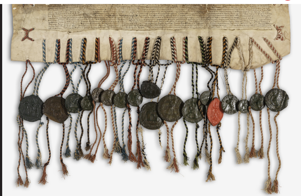
Exemplaire français / Französische Ausfertigung Archives nationales (France), J 724, n° 2

-----> Samedi/Samstag, 24.05.2025, 17:00-23:00 <-----