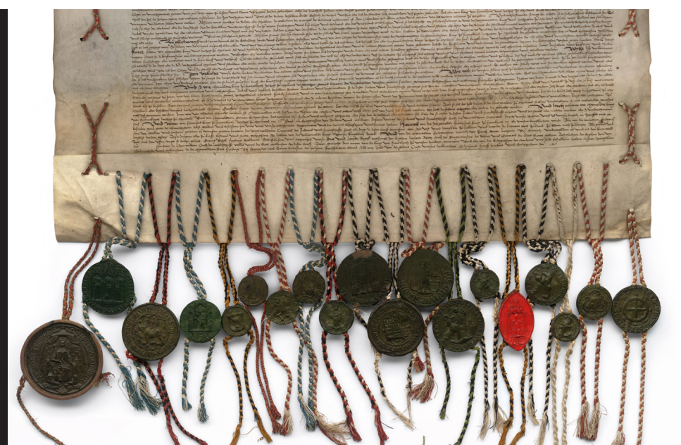
Exemplaire suisse / Schweizer Ausfertigung AEF/StAF, Titres de la France, Nr. 16