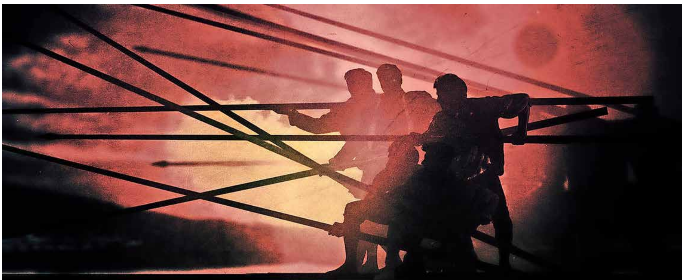
Eidgenössische Söldner - Animation aus dem Film «Der letzte Ketzler».