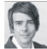
von Raffael Schuppisser

Ist das mit der Teilzeitarbeit also doch eine Lüge? Viele Männer wünschen sich mehr Zeit für ihre Familie und deshalb eine Teilzeitstelle. Doch der Arbeitgeber erlaube es ihnen nicht, klagen sie. Jene aber, die es geschafft haben, sind unglücklicher als ih-