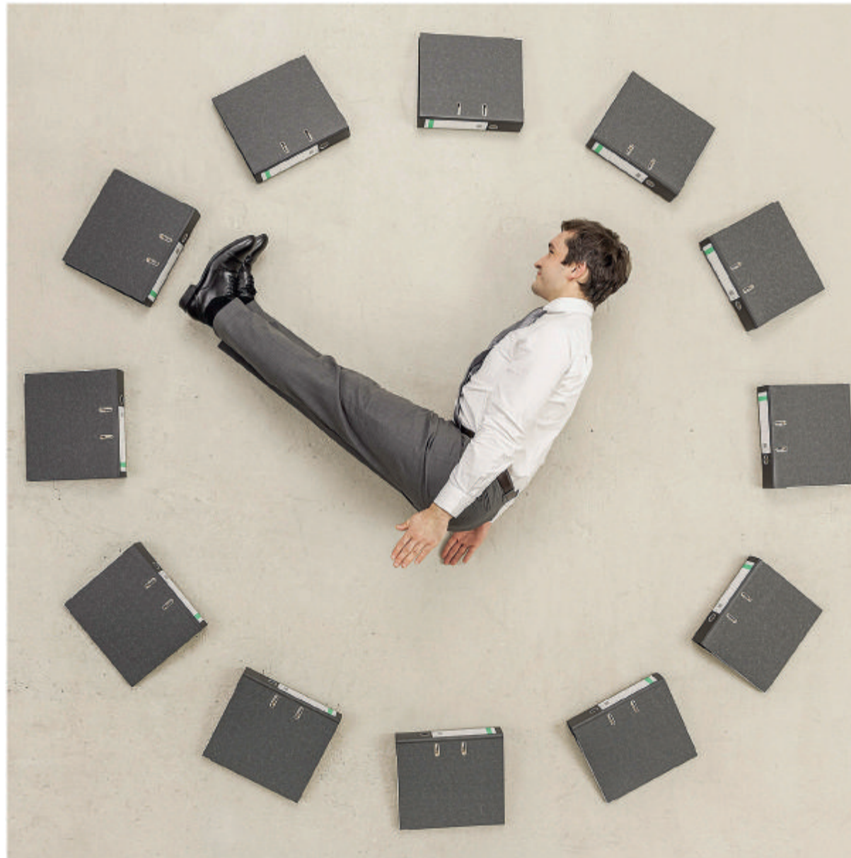
TEILZEITARBEIT IN DER SCHWEIZ Zahlen von 2016 in Tausend

Der Befund dieser unlängst veröffentlichten Untersuchung erstaunt aus mehreren Gründen. Zunächst widerspricht er dem in vielen westlichen Industrieländern beobachteten Phänomen, dass teilzeitarbeitende Frauen stärker diskriminiert werden als ihre vollzeitarbeitenden Kolleginnen. Derlei innergeschlechtliche Diskriminierung konnten die Autoren im Rahmen ihrer Studie nicht feststellen, belegt werden konnte dagegen der Umstand, dass Frauen in Vollzeitbeschäftigung deutliche bessere Karrierechancen