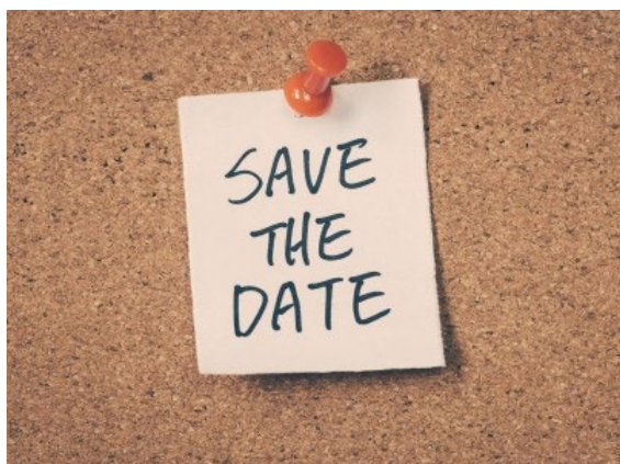
Table ronde sur la lutte contre la radicalisation en prison