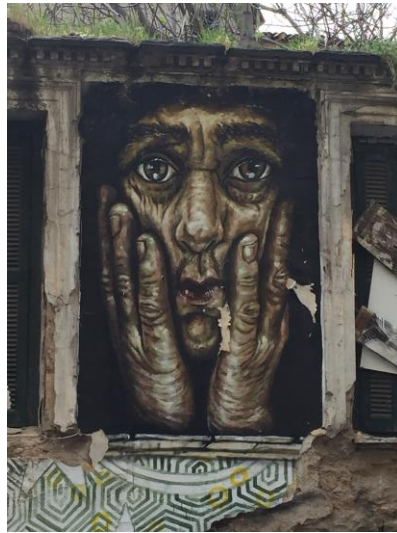
Street Art in Exarchia

Fotos (Wenn Sie möchten, können Sie hier Fotos hochladen)