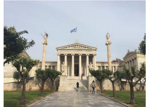
Die Uni im Stadtzentrum