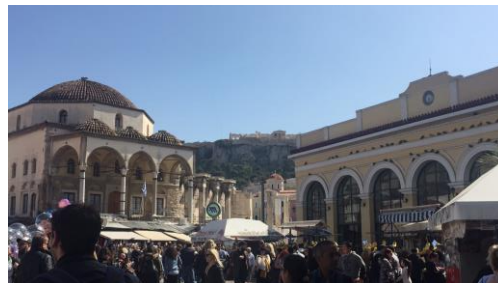
Stadtzentrum (Monastiraki mit Sicht auf die Akropolis)