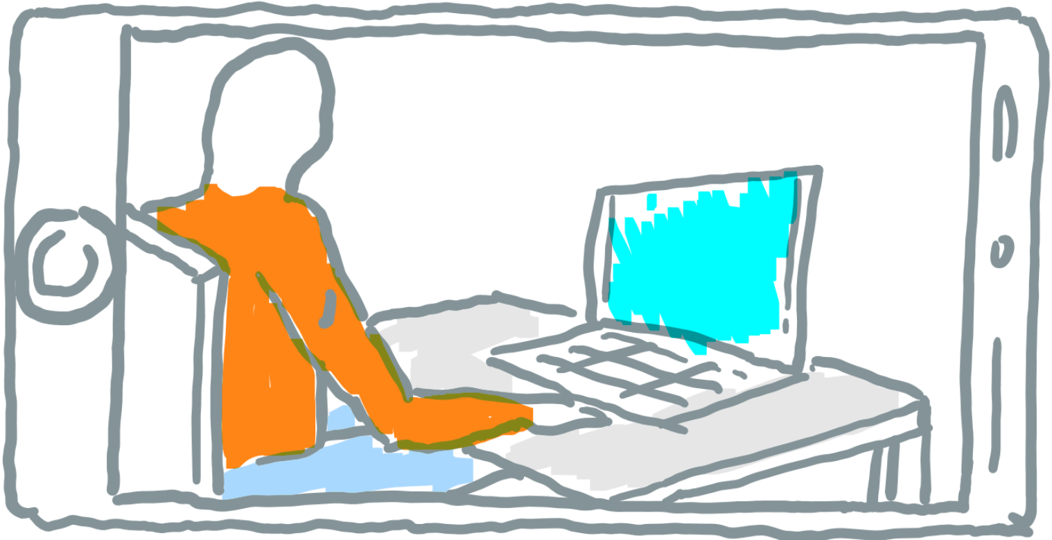
Image à montrer sur MS Teams via son smartphone