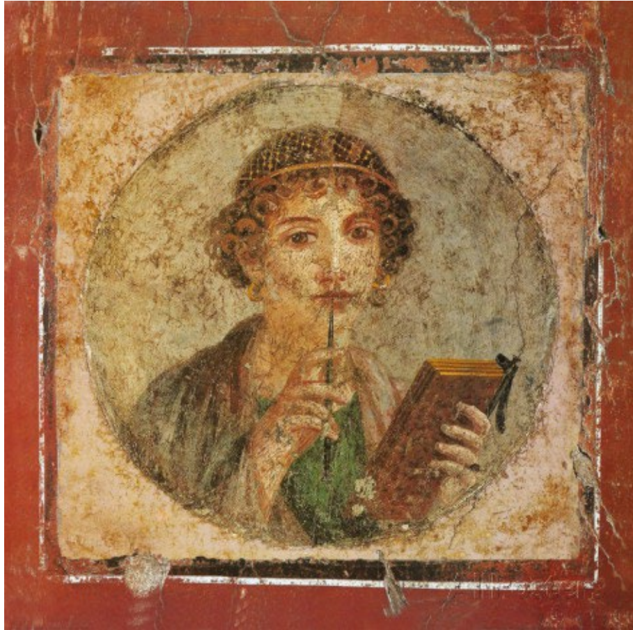
Fig. 1 : Portrait d'une jeune fille, dit « de Sappho », Pompéi, 1 er s. p.C. Fresque, diamètre : 29 cm. Musée archéologique national, Naples.