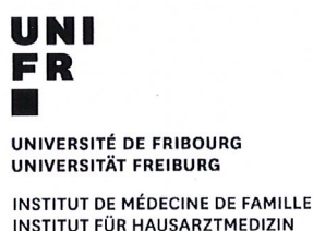
Prof. Pierre-Yves Rodondi Direktor Institut für Hausarztmedizin (IMF)

Jede Einrichtung setzt sich für eine Null-Toleranz-Politik ein, indem sie sich dazu verpflichtet, angemessene Massnahmen zu treffen und zu ergreifen, welche den Studierenden einen geschützten und vertraulichen Rahmen garantieren, in dem ihre Anliegen gehört werden. Hierzu steht den Studierenden ein klares, für jede Einrichtung angepasstes Verfahren zur Meldung des Vorfalls zur Verfügung, mit dem Ziel, Situationen, die die Integrität jeder einzelnen Person beeinträchtigen, insbesondere in Bezug auf Mobbing, sexuelle Belästigung und Diskriminierung aufgrund des Geschlechts und der sexuellen Orientierung, zu begrenzen, aufzudecken und in rechtmässiger und effizienter Weise darauf zu reagieren.