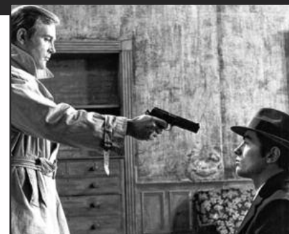
Alain Delon (à dr.) dans «Le samouraï».

celui du tueur engagé sur contrat, du polar pour enfants ou encore – il ne faut pas le rater – de la course-poursuite. Ainsi, Bullitt (Peter Yates 1968) montre aussi bien l'importance de la musique (de Lalo Schiffrin, pour la première partie de la fameuse course-poursuite à travers San Francisco, sans effets spéciaux mais si efficace) que l'importance de l'absence de musique (de Lalo Schiffrin aussi, interprétée par Ford Mustang et Dodge Charger, si on peut dire) au cinéma. L'extrait est superposé à The French Connection de William Friedkin et, surtout, au tout récent Drive de Nicolas Winding Refn, qui montre que la