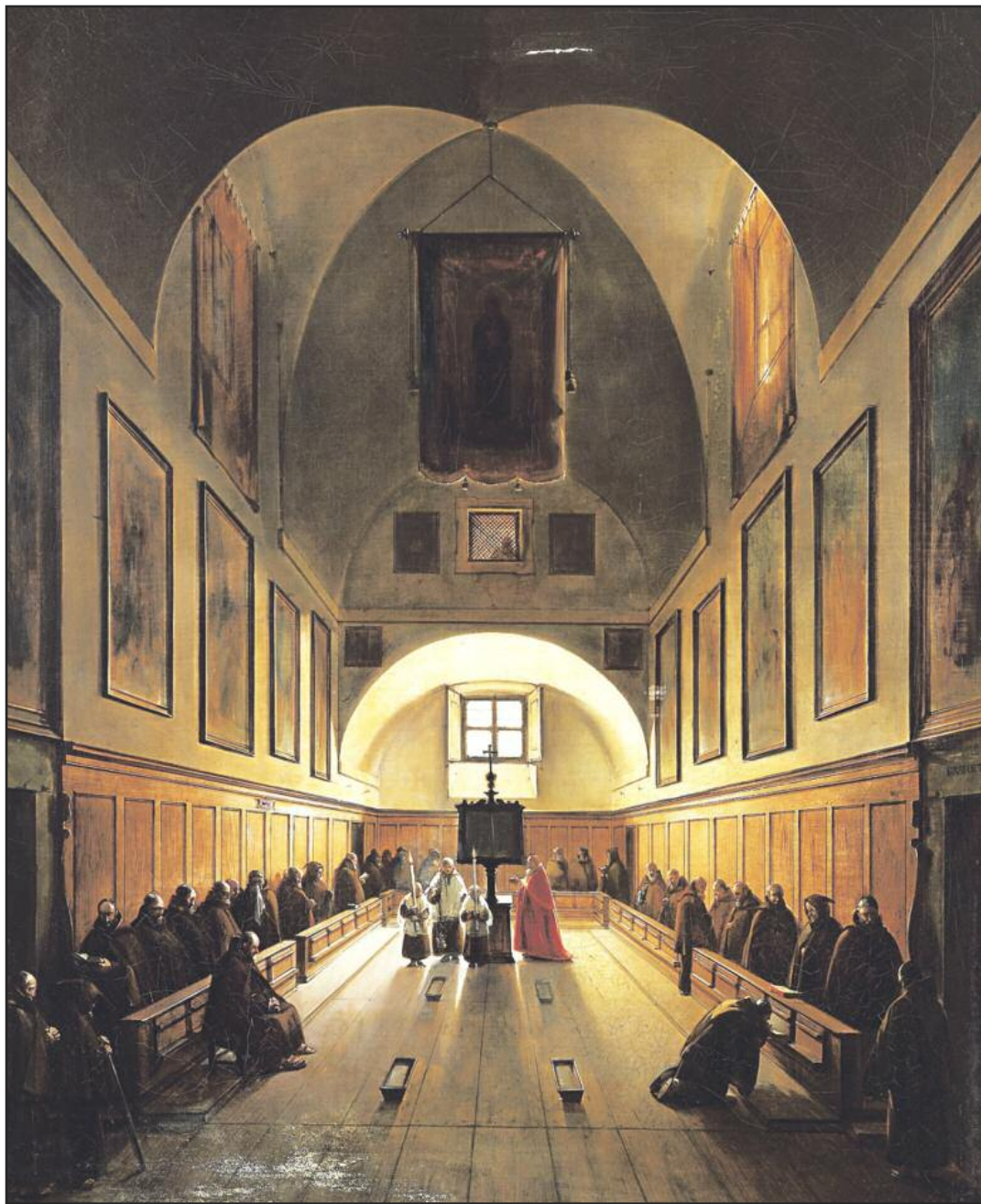
Intérieur du couvent des Capucins, œuvre fameuse de François Marius Granet, dont Bruno Racine a fait un personnage de roman.

Le livre traverse donc l'œuvre, s'arrêtant sur des tableaux précis, au gré des préférences de l'auteur. Racine devine les goûts de Granet, reconstitue les anecdotes à la source de nombreux