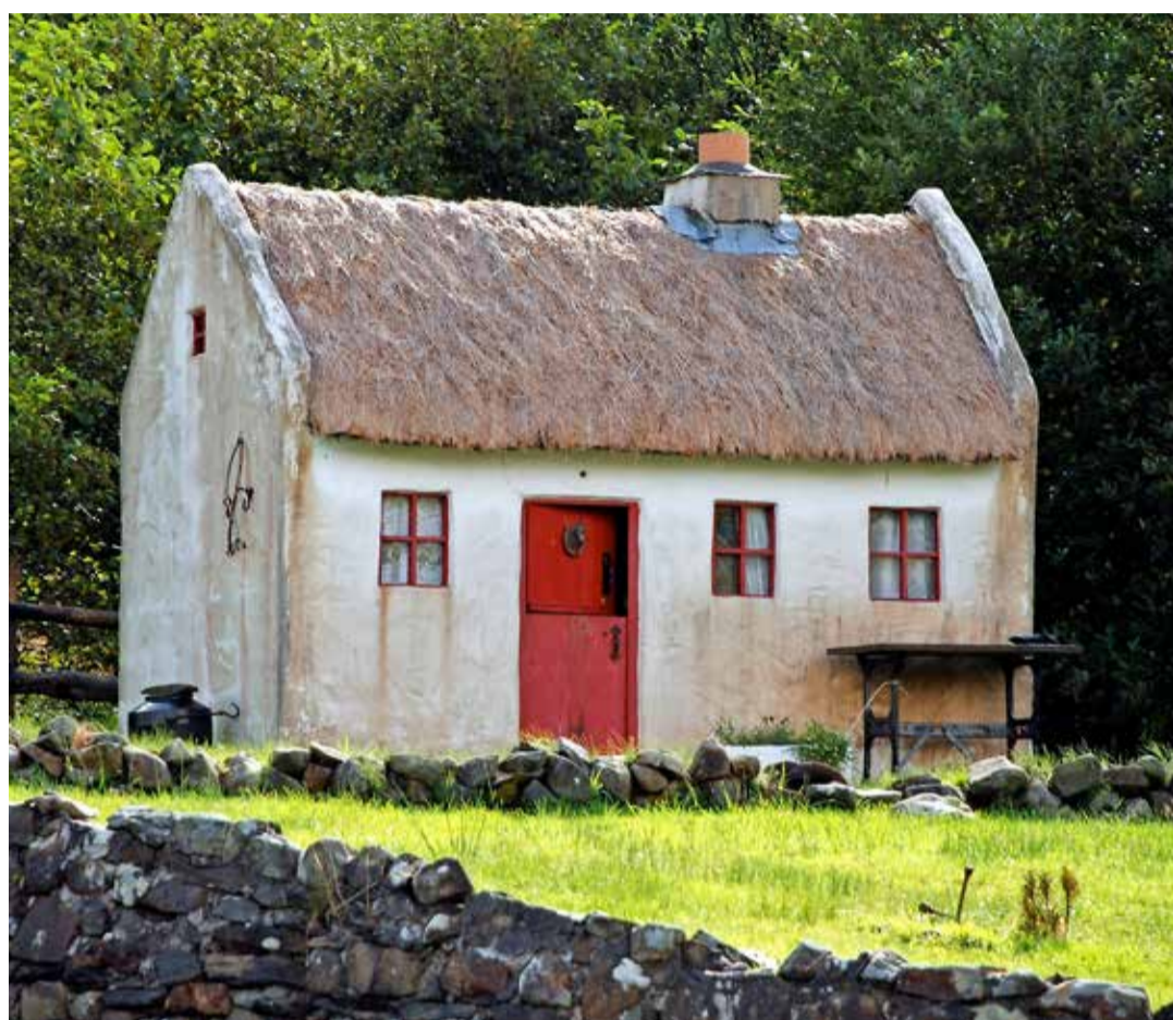
Old House doit ressembler à cette maison, une bâtisse faite de terre, de paille et de tronçons de mâts.