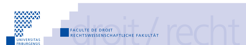
Université de Fribourg, Campus Péroilles II, (Bd. de Péroilles 90)