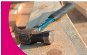
Indices des prix des matériaux KBOB