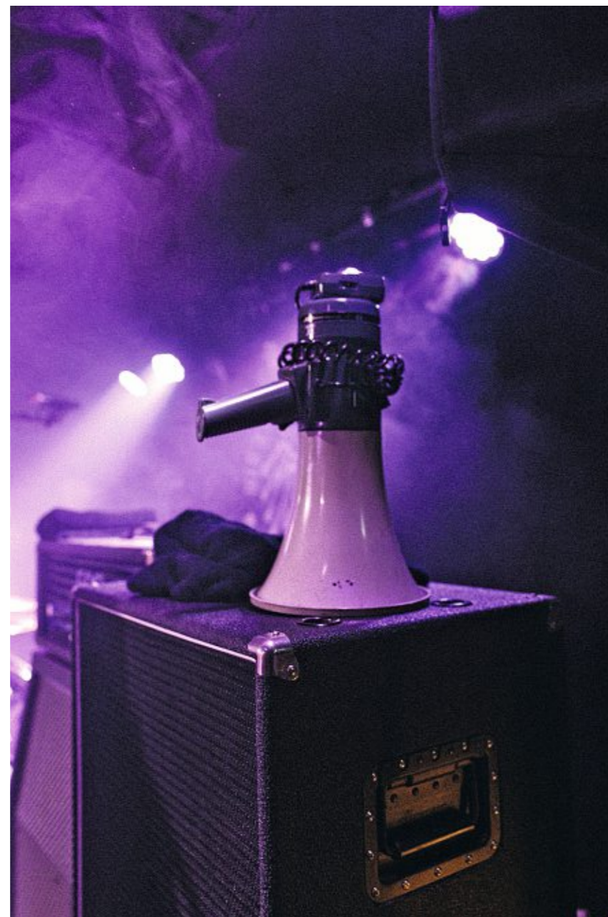
Das Megafon ist eine Art Harfe des Punks: Konzert in Düsseldorf, September 2025.

Einer der neuen Songs heisst «Was ist mit uns los?». Erweitern wir die Frage: Was ist gerade mit Deutschland los?