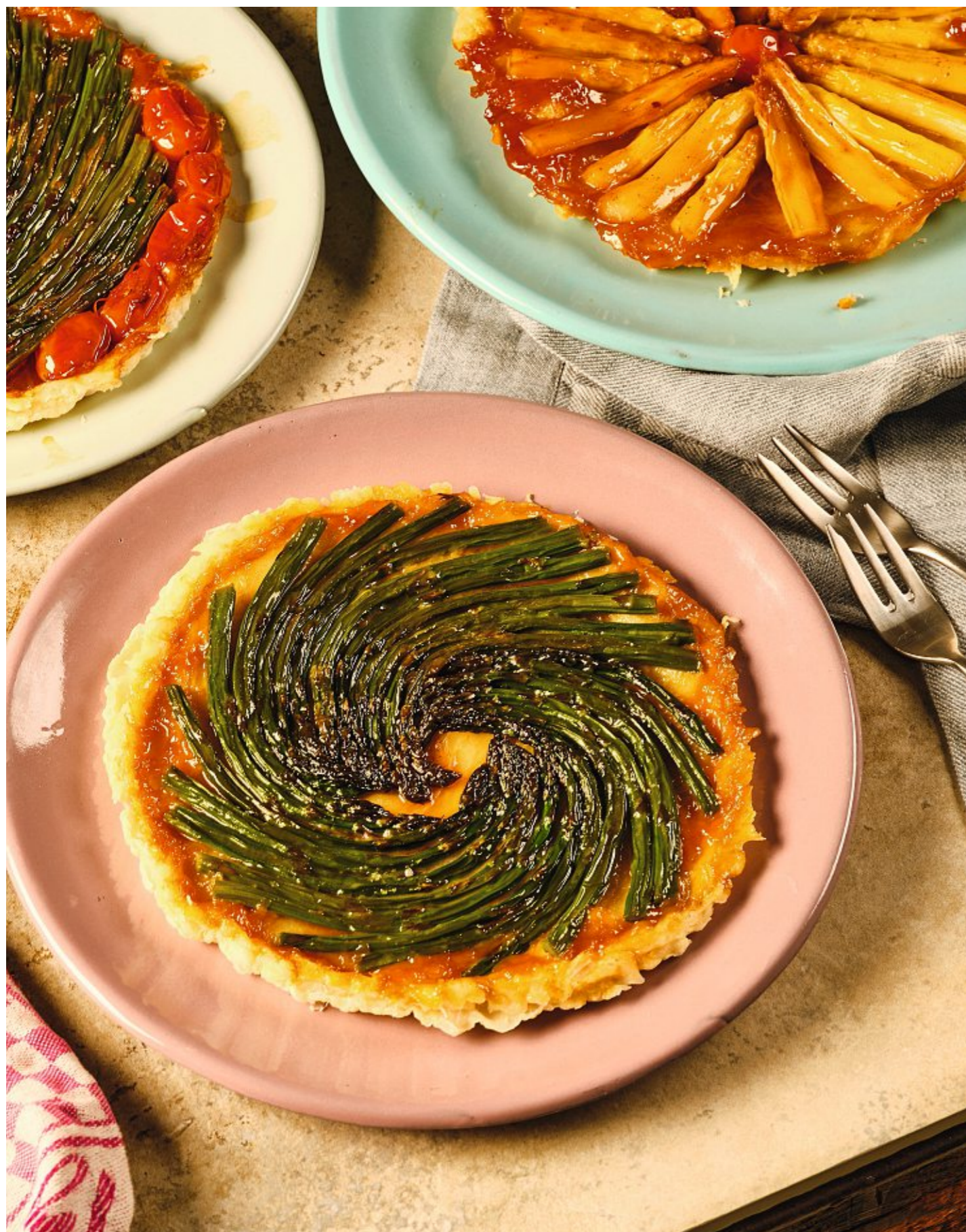
Nahrhafter Kontrast: Wenn sich zum Spargel eine Tarte Tatin gesellt, gerät unser Autor in eine Art Trance.

An dieser Stelle wurde unlängst die Spargelsaison eröffnet. Hier folgt keineswegs mehr vom Selben, sondern: eine unerlässliche Ergänzung.