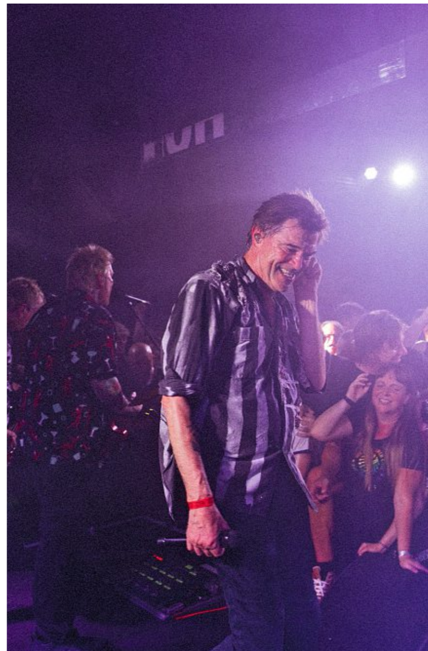
«Mit jeder Menge Spass verbunden»: Campino beim Auftritt der Toten Hosen in Düsseldorf.

Was vermisst Ihre Frau am meisten in der Musik der Toten Hosen?