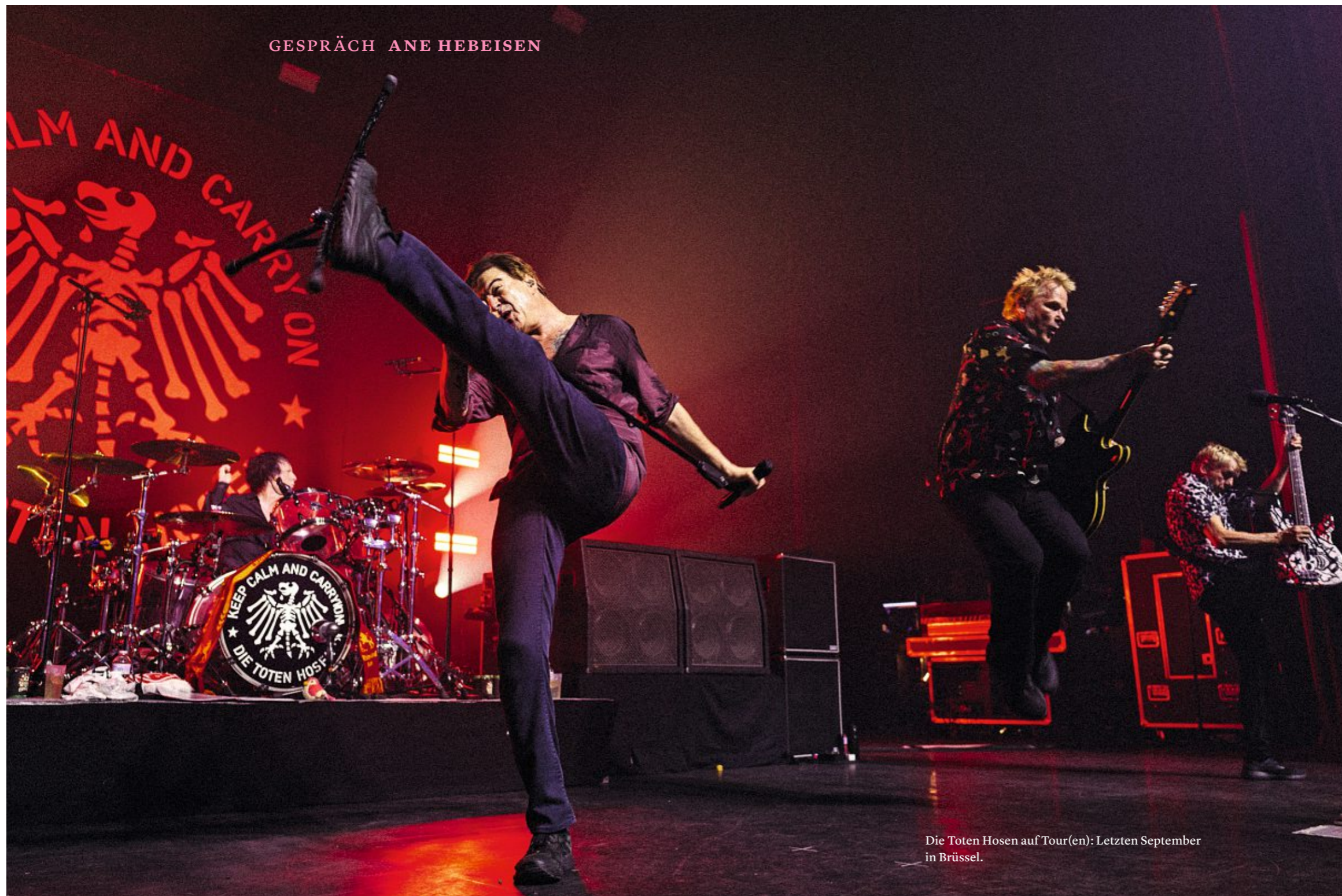
Die Toten Hosen auf Tour(en): Letzten September in Brüssel.

Campino erscheint ganz in Schwarz, mustert die Szenerie in der Hotel-Lounge mit einer gesunden Grundkepsis, wohlwollend, aber keinesfalls ranschmeislerisch. Er ist dreiundsechzig Jahre alt, Kühlerfigur der Toten Hosen, zudem seit fast viereinhalb Jahrzehnten der Lieblingspunk der Deutschen und der Bierseiligen.