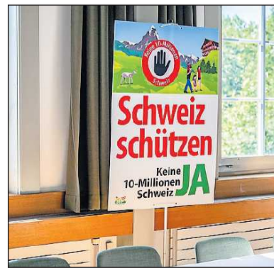
Mit solchen Plakaten warb die SVP für ihre Initiative.