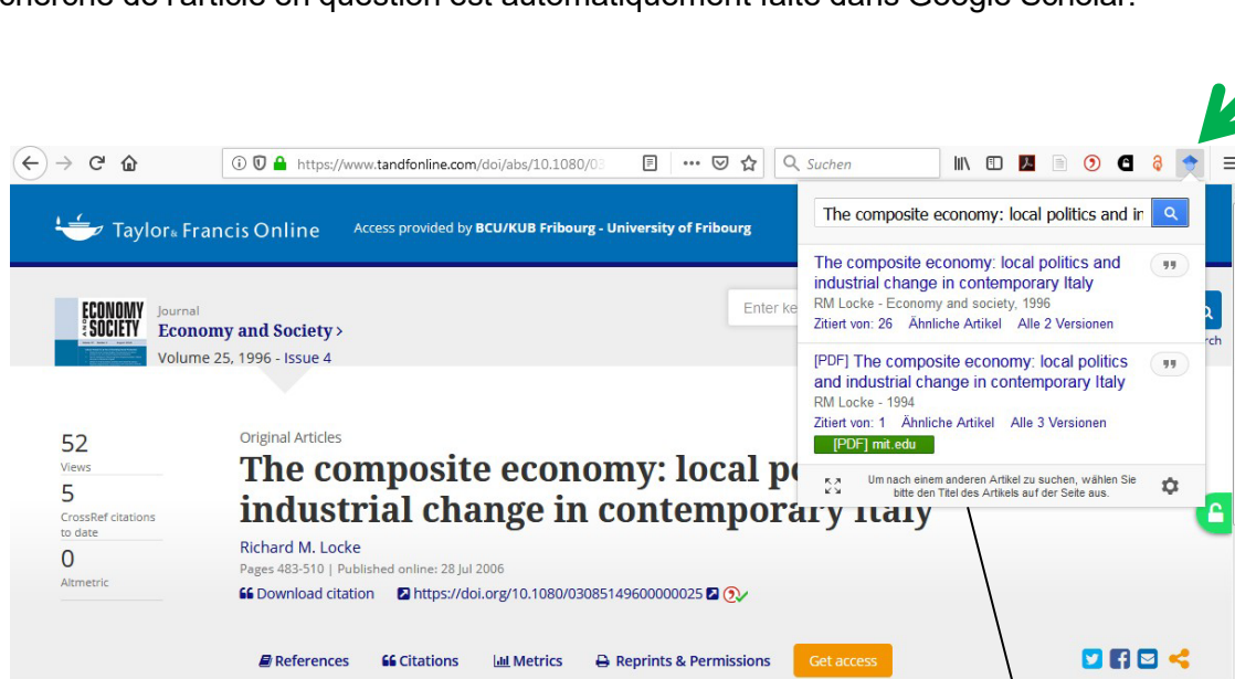
Résultats de recherche dans Google Scholar