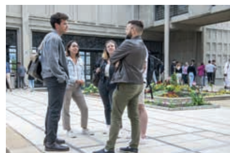
Miséricorde: Pause

certains domaines, ChatGPT dérangera, dans d'autres, il pourra être utile. Comment exactement ? Nous l'apprendrons en temps voulu.