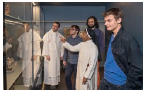
Études au Musée de la Bible+Orient

la réflexion philosophique en théologie fondamentale, la conscience historique en histoire de l'Église, la finesse juridique en droit canonique, l'empathie psychologique en théologie pastorale et bien d'autres choses encore. La Faculté de théologie est l'endroit idéal pour ceux qui souhaitent se former de manière complète. J'aimerais donc terminer mon petit mot de bienvenue par un verset biblique: Évangile selon saint Jean 1,39b. Si vous êtes curieux de savoir ce qui est écrit là, je vous invite à le consulter.