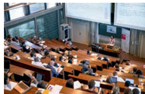
Service Pack

date (et non le moindre) est un accord avec Turin, qui donne à nos étudiants la possibilité d'étudier ici et là et de s'ouvrir ainsi au monde, qui a besoin de personnes qui considèrent la diversité comme une chance et non comme une menace.