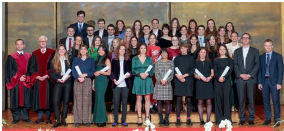
Remise des diplômes de master et diplômes fédéraux de médecine humaine à l'Aula Magna