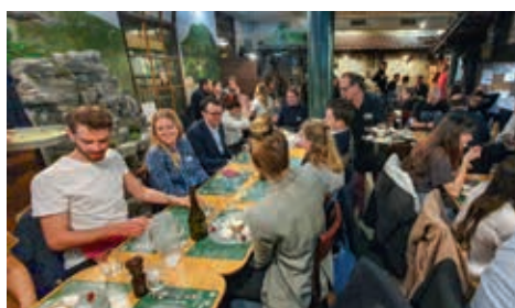
Soirée Fondue

De telles retrouvailles ont aussi eu lieu autour d'une fondue traditionnelle à Zurich et à Genève, ainsi que pour un apéritif de la St-Nicolas à Berne. Ce sont autant de moments forts de l'année de