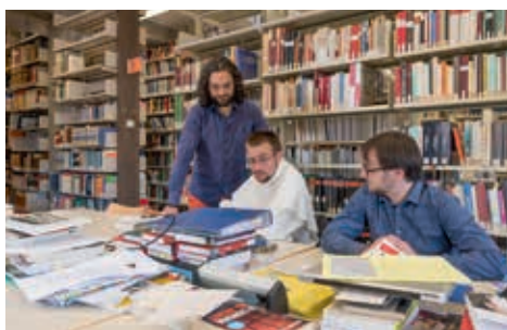
Étude à la bibliothèque

Peu de gens sont conscients de la diversité des méthodes au sein de la théologie: On y apprend le sens littéraire dans l'étude des textes bibliques,