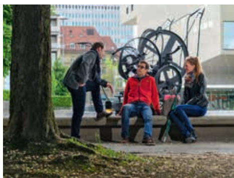
près de la fontaine de Tinguely

Et quoi d'autre? Nous avons un réseau fort et de plus en plus international. Le dernier en