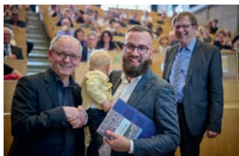
Cérémonie de remise des diplômes 2023

En règle générale, les membres d'Alumni FRYTHEO ont accès aux nombreux congrès, colloques et autres manifestations de la Faculté de théologie dont ils sont informés à chaque fois. Deux événe-