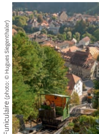
Funiculaire