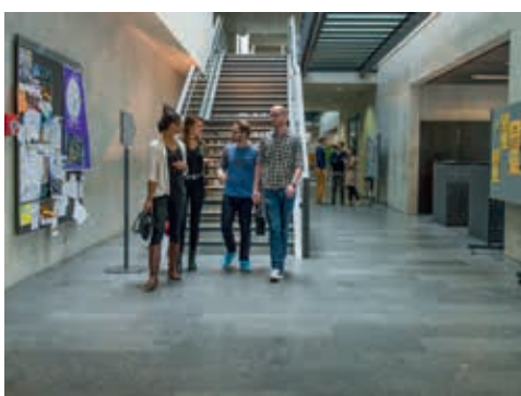
Dans le bâtiment de Pérolles II

les étudiant-e-s en publiant des articles qui leur sont dédiés et auxquels elles et ils peuvent aussi contribuer. Dans le même ordre d'idée, nous avons perpétué le cycle de tables rondes que nous organisons avec Fribourg International, la Chambre de commerce et de l'industrie France Suisse (CCI) et la Promotion économique du Canton de Fribourg. Cette année le thème retenu était le métavers. Environ cent cinquante personnes ont assisté à cette table ronde A la rentrée prochaine, nous traiterons des bouleversements géopolitiques mondiaux et de leurs conséquences pour la Suisse.