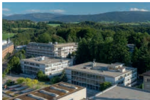
Pérolles I

concurrency nationale ou internationale entre les universités augmente. Comment abordez-vous ces grandes questions?