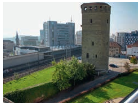
Tour Henri

Les anciens étudiants ont une importance toujours plus grande pour une université. Que peut faire l'université pour les alumnae et les alumni afin de favoriser leur engagement et de maintenir l'attractivité de l'université au-delà des études?