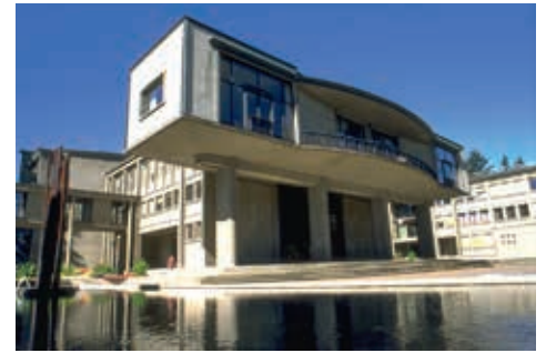
Miséricorde, Rectorat

Nous avons du potentiel en matière de collecte de fonds. Deux nouveaux clusters de recherche interfacultaires sont en train de voir le jour: un nouveau centre de recherche et d'innovation dans le domaine des sciences alimentaires, ainsi qu'un cluster sur le thème «L'avenir de la Suisse». En principe, ces deux thèmes se prêtent à un Pôle de recherche na-