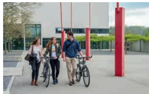
Dans la cour intérieure de Pérolles II

Enfin, nous avons noué une collaboration avec la Haute école spécialisée des Grisons en proposant un master joint dans le domaine des sciences de la communication, en Digital Communication and Creative Media Production. L'idée de cette collaboration est d'exploiter les complémentarités de nos deux institutions, afin de proposer une nouvelle offre attractive aux étudiant-e-s.