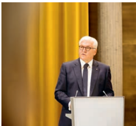
Frank-Walter Steinmeier