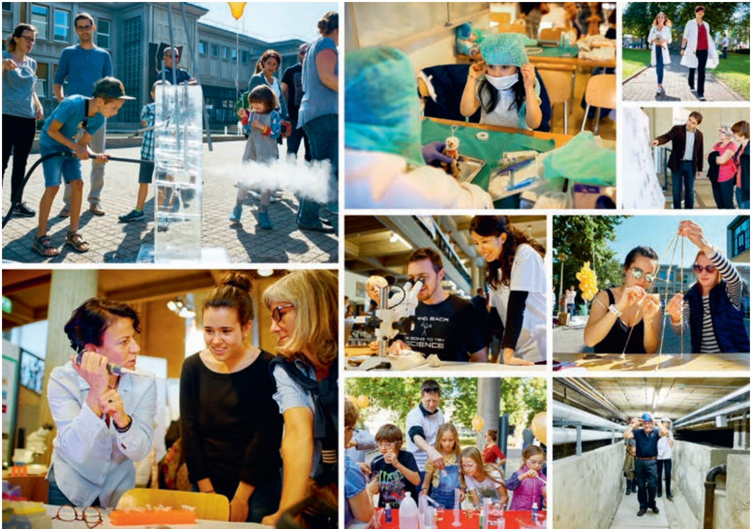
Quelques photos d'Explora 2016