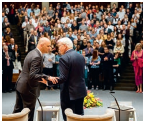
Alain Berset et Frank-Walter Steinmeier

«Une visite d'Etat sous le signe de relations et de liens étroits»: c'est avec ces mots que le Président de la République fédérale d'Allemagne Frank-Walter Steinmeier a salué le public le 26 avril dernier dans l'Aula Magna de l'Université de Fribourg qui affichait complet. Au programme, une table ronde sur la question de savoir si la démocratie peut exister au XXI e siècle. On comptait au nombre des participants à cette table ronde le Président de la