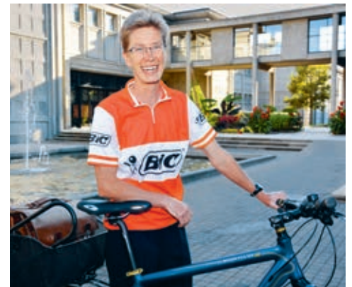
Une rectrice sportive

Je ne vois pas de vrais désavantages à l'autonomie: mais bien sûr que son application doit être discutée en détail et, dans ce sens, les différents modèles présentent certainement des avantages et inconvénients.