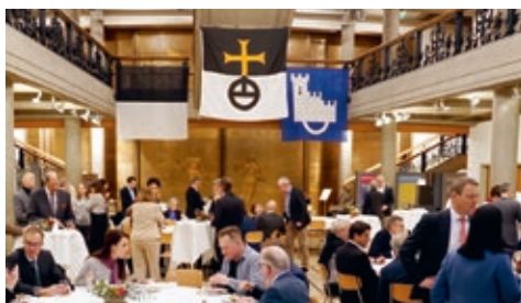
Repas annuel de la Fondation de l'Université de Fribourg

La Fondation de l'Université de Fribourg est une fondation opérationnelle et une organisation interne à l'université. Présidée par la rectrice ou le recteur, la direction exécutive est assurée par la ou le responsable du service du développement universitaire, service spécialisé dans la gestion de fonds tiers privés de type donations. La ou le vice-recteur en charge du développement universitaire participe au Conseil de Fondation avec voix consultative, pour assurer une bonne coordination et l'élaboration d'une stratégie qui soit en phase avec les besoins de développement de l'institution universitaire. Ainsi structurée, la fondation peut accompagner le Rectorat, mais aussi les facultés et les professeurs qui travaillent avec des fonds tiers privés de manière professionnelle, efficace et flexible.