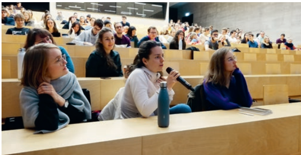
Questions des étudiants durant la réunion annuelle de novembre 2019

et de connaître leurs aînés. Le 14 novembre 2019 (photo), l'auditoire Joseph Deiss accueillait des étudiants passionnés, venus écouter les défis de bio-ingénierie des transplantations de peau ou de réhabilitation à la marche après lésion médullaire, ou enfin les défis dans la lutte contre le virus Ebola.