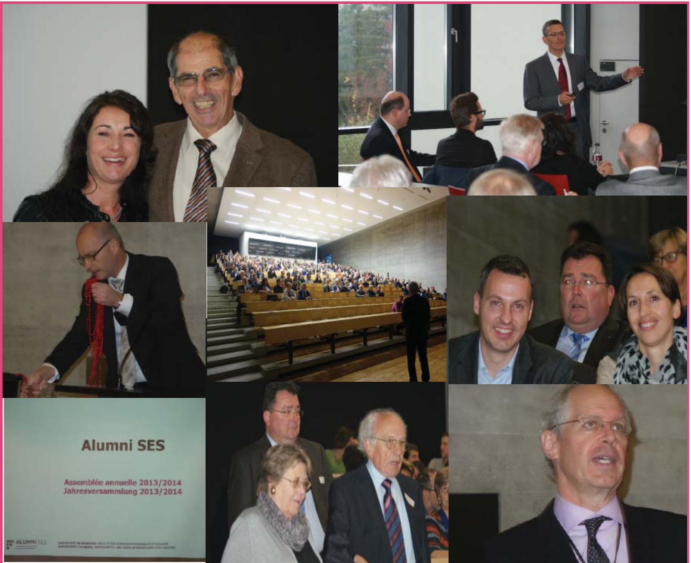
Impressions de la dernière journée annuelle des Alumni SES Impressionen der letzten Jahrestagung der Alumni SES