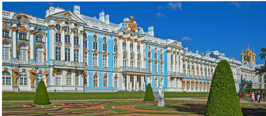
Links: Katharinenpalast in Zarskoje Selo / rechts: Kloster Optina, wo Dostojewski und Gogol Rat suchten

UNIVERSITÉ DE FRIBOURG UNIVERSITÄT FREIBURG