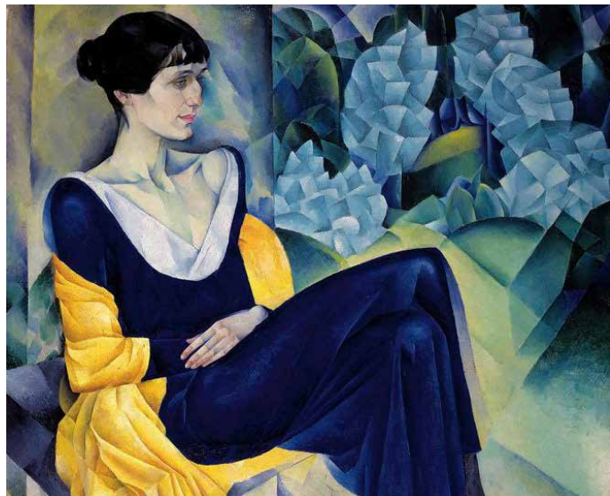
Die Dichterin Anna Achmatowa, von Nathan Altman (Russisches Museum)

In der Region von Kaluga liegt das Kloster Optina, im 19. Jahrhundert ein spirituelles Zentrum für viele Intellektuelle und Schriftsteller. Gogol, Dostojewski und andere suchten hier bei den Mönchen Rat. Der Starzen (geistlicher Vater) Amwrosij wurde zum Vorbild des Starzen Sossima in den «Brüdern Karamasow». Führung mit Schwerpunkt Starzentum und russische Schriftsteller des 19. Jahrhunderts. Weiterfahrt nach Jasnaja Poljana, dem Landgut inmitten der unberührten russischen Landschaft, wo Lev Tolstoj geboren wurde und die meiste Zeit seines Lebens verbrachte.