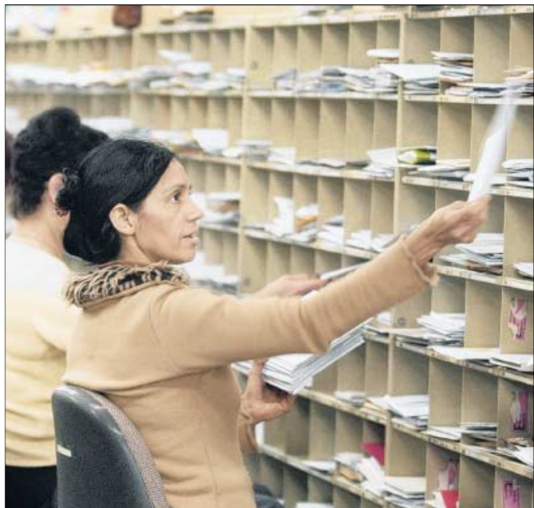
Leichte Briefe sind teuer in der Beförderung, schwere eher günstig. Insgesamt kann sich das Preisniveau der Schweizer Briefpost im internationalen Vergleich gut sehen lassen.

Die Idee des schweizerischen Briefpostindex (BPI) besteht schliesslich darin, den Quotienten zu bilden aus dem fiktiven durchschnittlichen Preisstand des Warenkorbs von BPI-Dienstleistungen im Vergleichsland (umgerechnet in Franken) und dem durchschnittlichen Preisstand dieses Warenkorbs in der Schweiz. Für Deutschland ergibt sich etwa durch die Division des gewichteten durchschnittlichen Preisstands von 1.28 durch den gewichteten durchschnittlichen Preisstand von 1.02 in der Schweiz der Indexwert 125. Dieser Wert gibt an, dass der betrachtete Briefwarenkorb in Deutschland um 25% teurer ist als in der Schweiz. Bei diesem Index dienen die Sen-