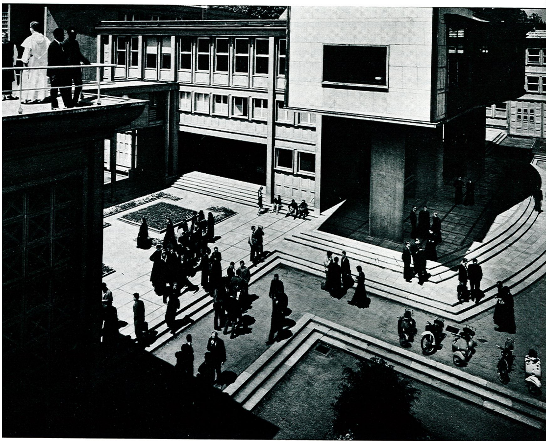
Le quart d'heure académique Bâtiments universitaires Miséricorde