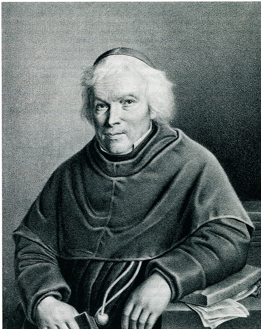
Fig. 2: Grégoire Girard (1765–1850).

M. François Bourquenoud naquit à Charmey le 25 avril 1785, dans cette belle vallée de la Gruyère fribourgeoise, si riche en beautés de tous genres, surtout en plantes, qui y forment un véritable jardin botanique, soit dans les vallons dont toute cette contrée alpestre est coupée, soit sur les cimes et flancs des montagnes d'un aspect à la fois grandiose, imposant, varié à l'infini et gracieux comme les paysages qu'à tracés Salomon Gessner.