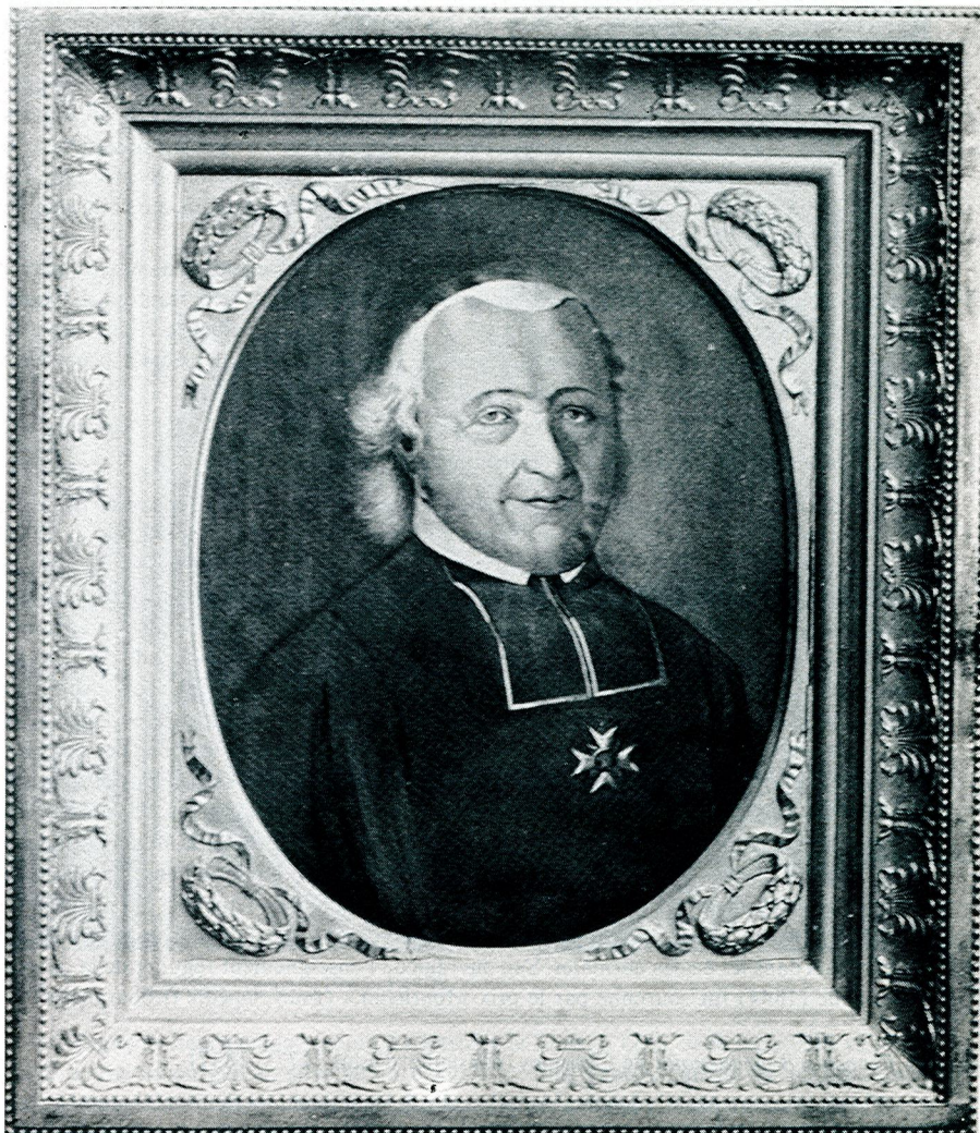
Fig. 1: Charles Aloyse Fontaine (1754–1834).

a) Charles Aloyse Fontaine (1754 Fribourg 1834), ecclésiastique et homme de science (fig. 1)