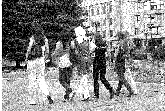
Studentinnen der Kazaner Staatlichen Universität tragen sowohl «westliche» als auch «korrekte muslimische» Kleidung.

Obschon tatarische wie auch muslimische Identitäten also nicht zwingend übereinstimmen und auch innerlich sehr fragmentiert sind, so spielt die Religion doch in den grundsätzlichen nationalen Diskursen der tatarischen Jugend eine herausragende Rolle. Der Islam dient besonders seit der Zeit der nationalen Bewegung der 1980er und 1990er Jahre zunehmend als «ethnischer Marker». Die Feststellung einiger Forscher, es komme zu einer «Islamisierung der tatarischen Identität» und einer «Tatarisierung islamischer Identität» trifft wohl in gewissem Maße zu. Solch eine Entwicklung kann aber nicht ausschliesslich mit dem historischen Hintergrund der sowjetischen Nationalitätenpolitik und deren Verständnis von Ethnizität erklärt werden, sondern hängt auch mit dem gegenwärtigen gespaltenen